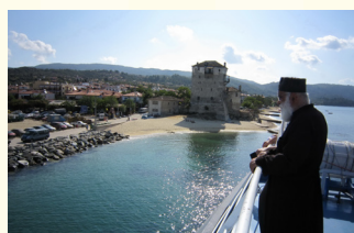
OBILAZAK SVETE GORE

Tokom Vašeg boravka biće organizovani fakultativni izleti, o rasporedu se možete informisati kod predstavnika ili putem oglasnih tabli koje se nalaze u Vašim kućama.