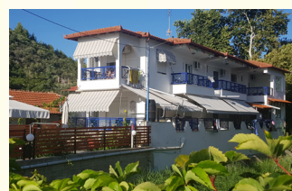
KUĆA STAM FLOR