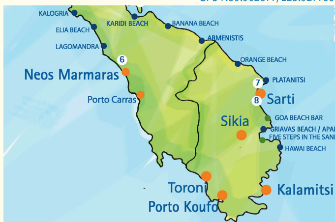
MAPA PORTO KOUFO