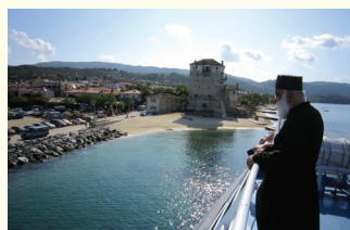
OBILAZAK SVETE GORE

Tokom Vašeg boravka biće organizovani fakultativni izleti, o rasporedu se možete informisati kod predstavnika ili putem oglasnih tabli koje se nalaze u Vašim kućama.