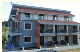
6. KUĆA TRITON GPS N40.09984/E23.77750