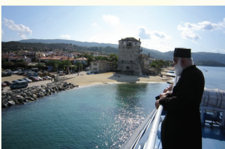
OBILAZAK SVETE GORE

Tokom Vašeg boravka biće organizovani fakultativni izleti, o rasporedu se možete informisati kod predstavnika ili putem oglasnih tabli koje se nalaze u Vašim kućama.