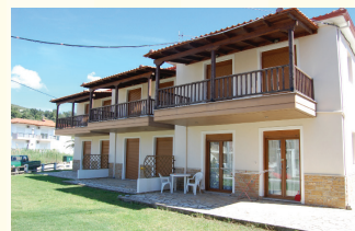
4. KUĆA KARAJANIS GPS N40.10019/E23.77746