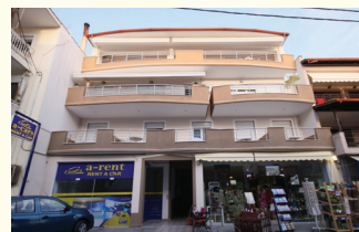
7. KUĆA ELLI GPS N40.09512/E23.782702