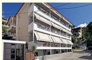
11. KUĆA ANESIS GPS N40.092858/E23.789058