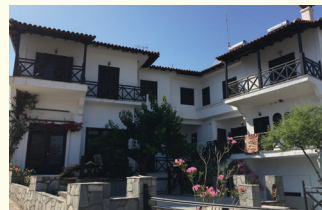
9. KUĆA ALFA ALFA GPS N40.091130/E23.789041