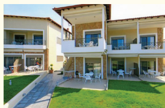
1. KUĆA DIOSKURI GPS N40.10001/E23.77751

Riba - psari Masline - iljes Sir - tiri Meso - kreas Pljeskavica - bifteki Piletina - kotopulo Krompir - patates Paradajz - tomata Sladoled - pagoto