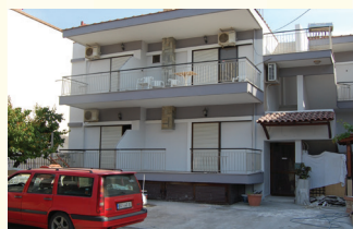
10. KUĆA NEFELI GPS N40.095856/E23.776558