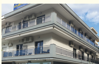
12. KUĆA SOLE A MARE GPS N40.093005/E23.786926