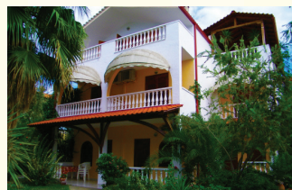
1. KUĆA FLOWER