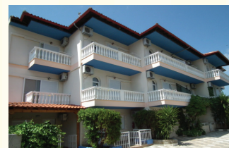
6. KUĆA ALEXANDROS - SAKIS II