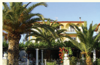
3. KUĆA FEY - SAKIS I