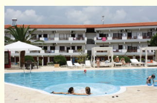
10. KUĆA BASIL