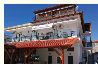
14 KUĆA TWINS