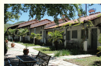
8. OLGA BUNGALOVİ