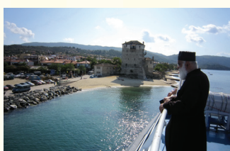
OBILAZAK SVETE GORE

Tokom Vašeg boravka biće organizovani fakultativni izleti, o rasporedu se možete informisati kod predstavnika ili putem oglasnih tabli koje se nalaze u Vašim kućama.