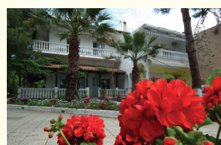
7. KUĆA OLGA,