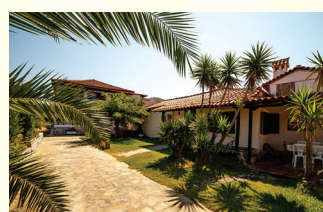
13 KUĆA DUVAS