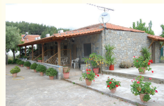
2. FLOWER BUNGALOVİ