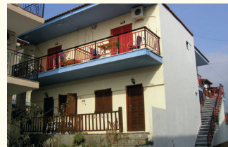
4 KUĆA FLORA